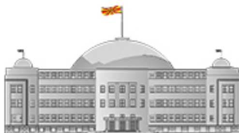
KUVENDI I REPUBLIKËS SË MAQEDONISË SË VERIUT